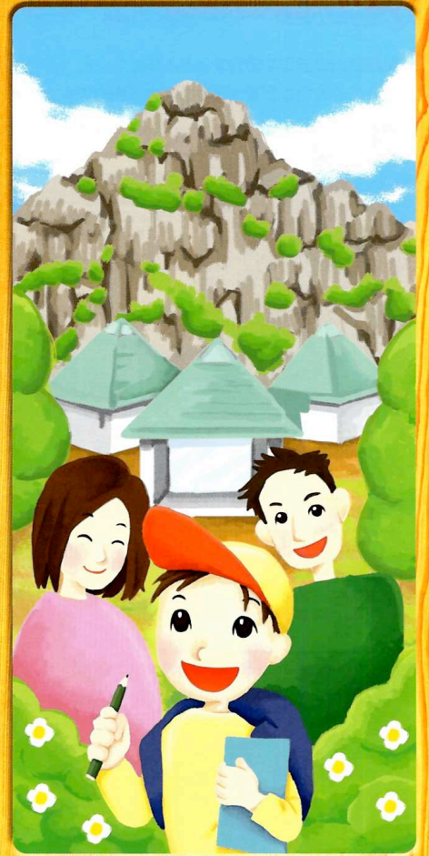
Ashio Environmental Learning Center